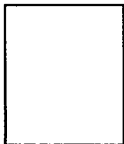
Ảnh chân dung 4 x 6